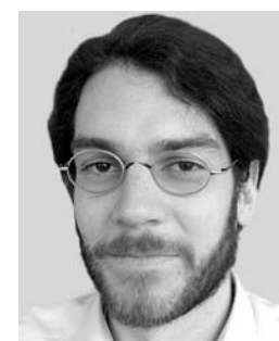
Von Clemens Rauchenwald

Small and Mid Caps (SMC). Die Häuser, die eine Mindestabdeckung in den einzelnen Sektoren erreichten, wurden gemäß der erzielten IR gereiht. Mittels eines Punktesystems, das auf den Platzierungen in den Sektoren basiert, wurden dann aus dieser Reihenfolge die Gewinner der sektorübergreifenden Wertungen ermittelt.