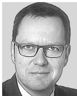
Von Ralf Frank

ment a priori verurteilt, sowie des rational-ökonomischen Postulats der Fair Disclosure unterstellten Behavioral Economics, dass Senior Manager in Unternehmen die Spiel- und Gestaltungsräume einnehmen, die man ihnen lässt. Immer dann, wenn Anleger im konstruktiven, bei fortwäh-